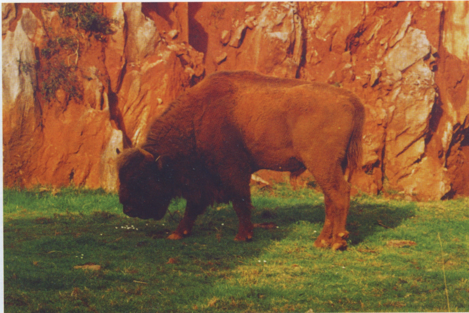
M 7293 POMPEJUSZ