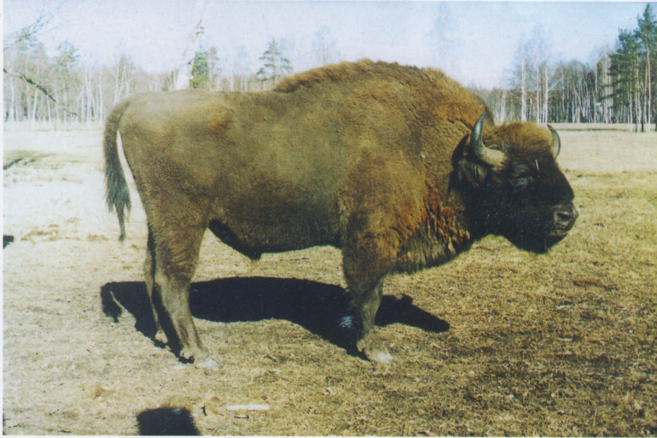
M 6734 GIMAS