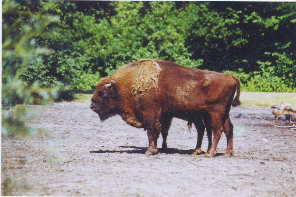
M 5135 DANDIN