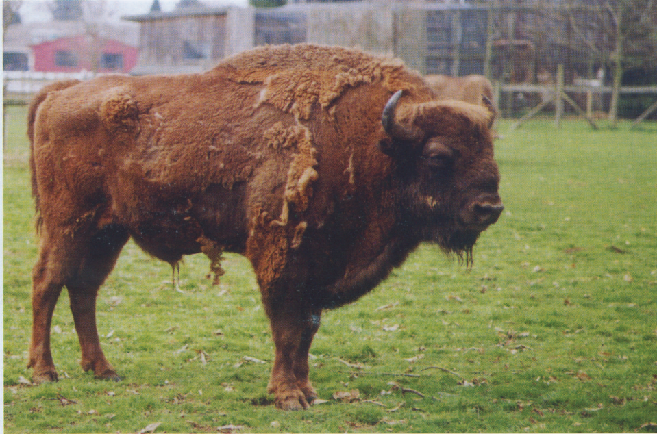
M 6077 GLEN COE