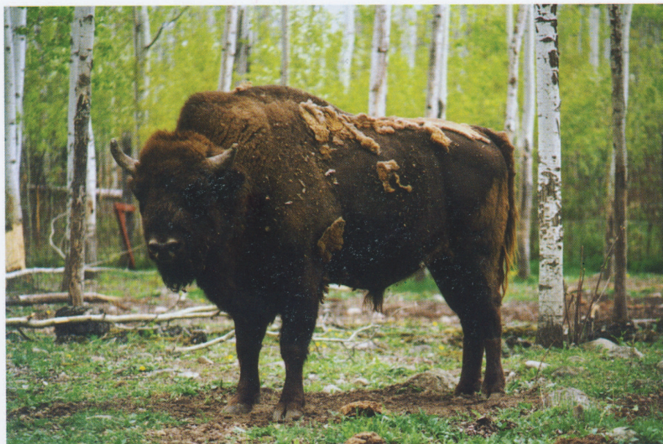
M 5532 COMMANDER