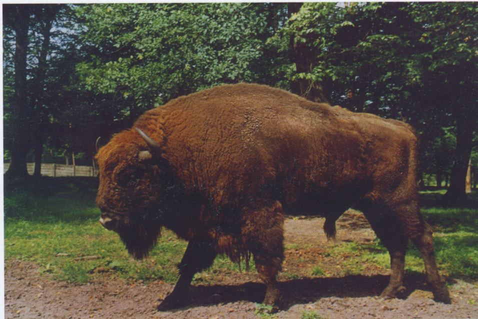
M 7767 POLARNIK