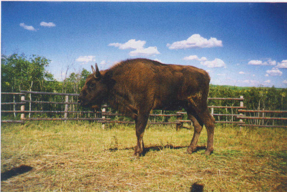
F 8634 ASEARTHA