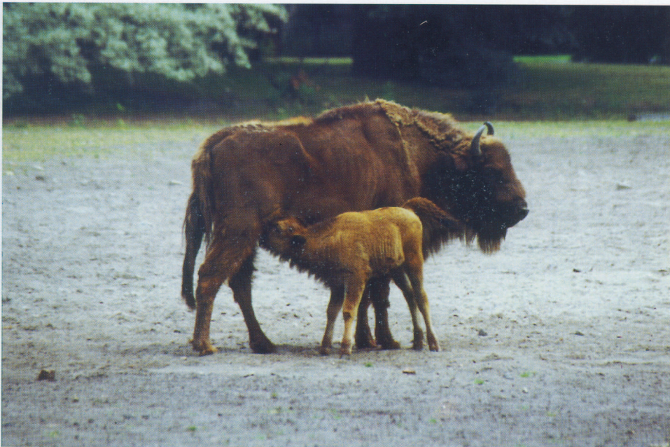
F 5818 TIRANA