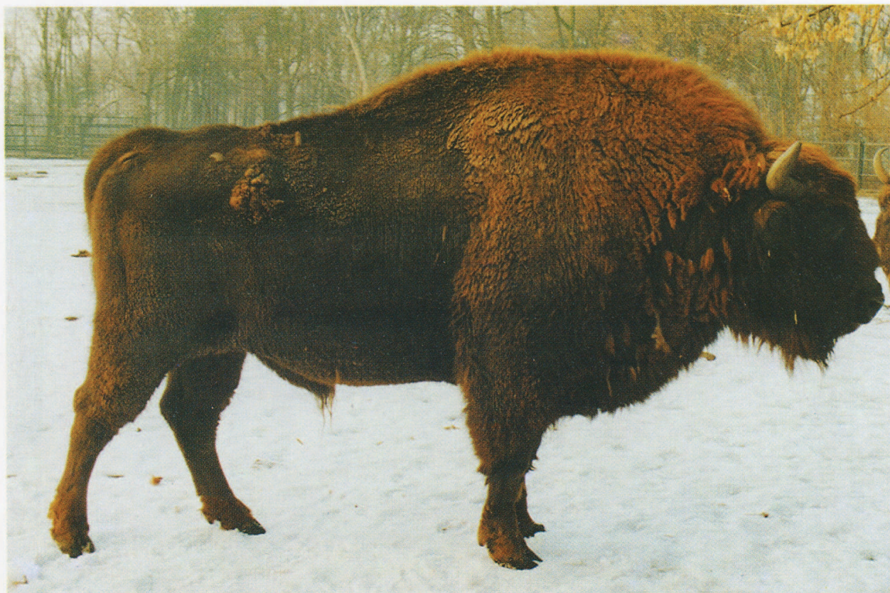
M 5804 PORPLES