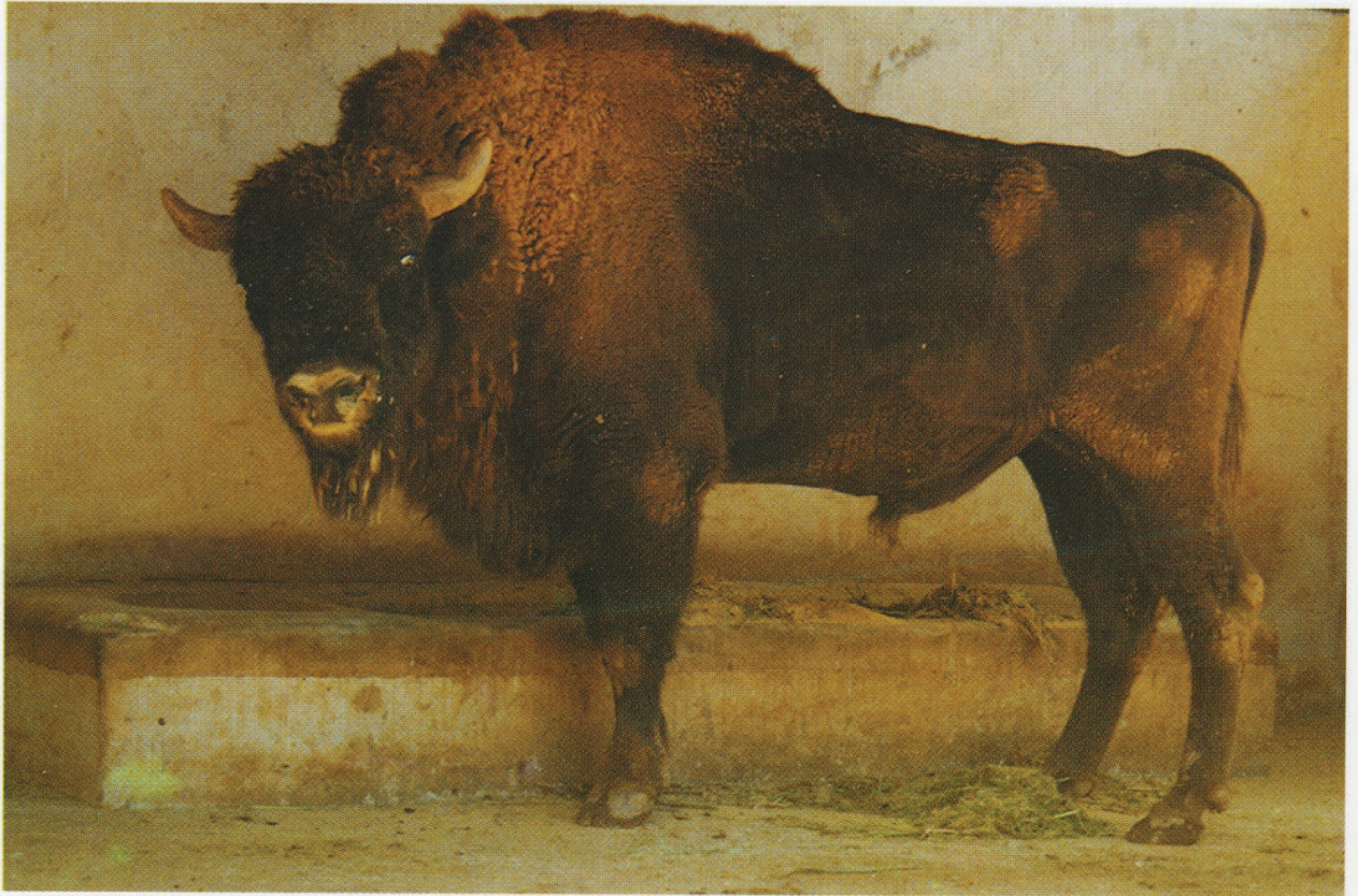
M 4804 ATINGUA