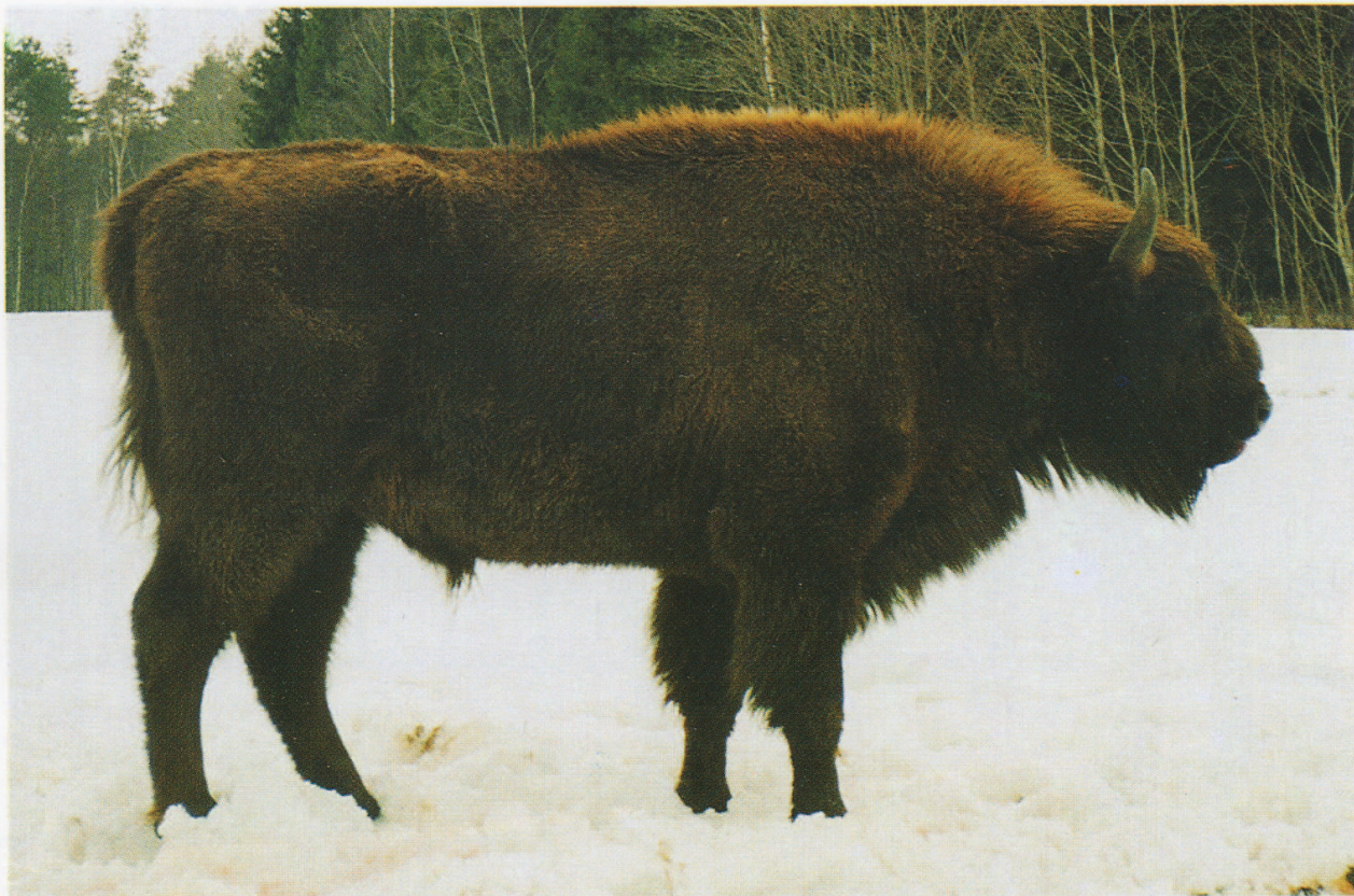
M 7173 GIKAS