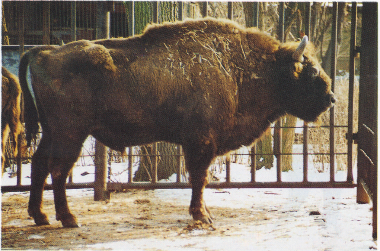
M 5588 DAG