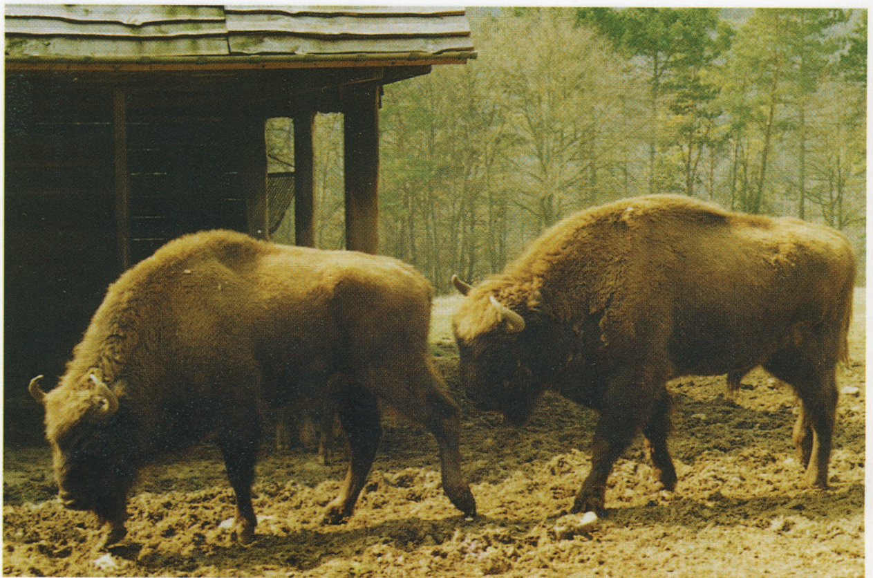
F 7306 AR-118, M 7571 AR-126