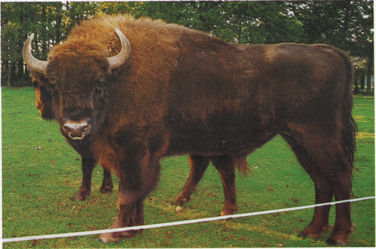
M 7844 DASEK