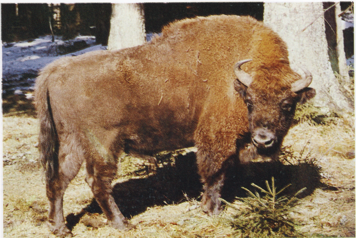
M 5840 ABIR