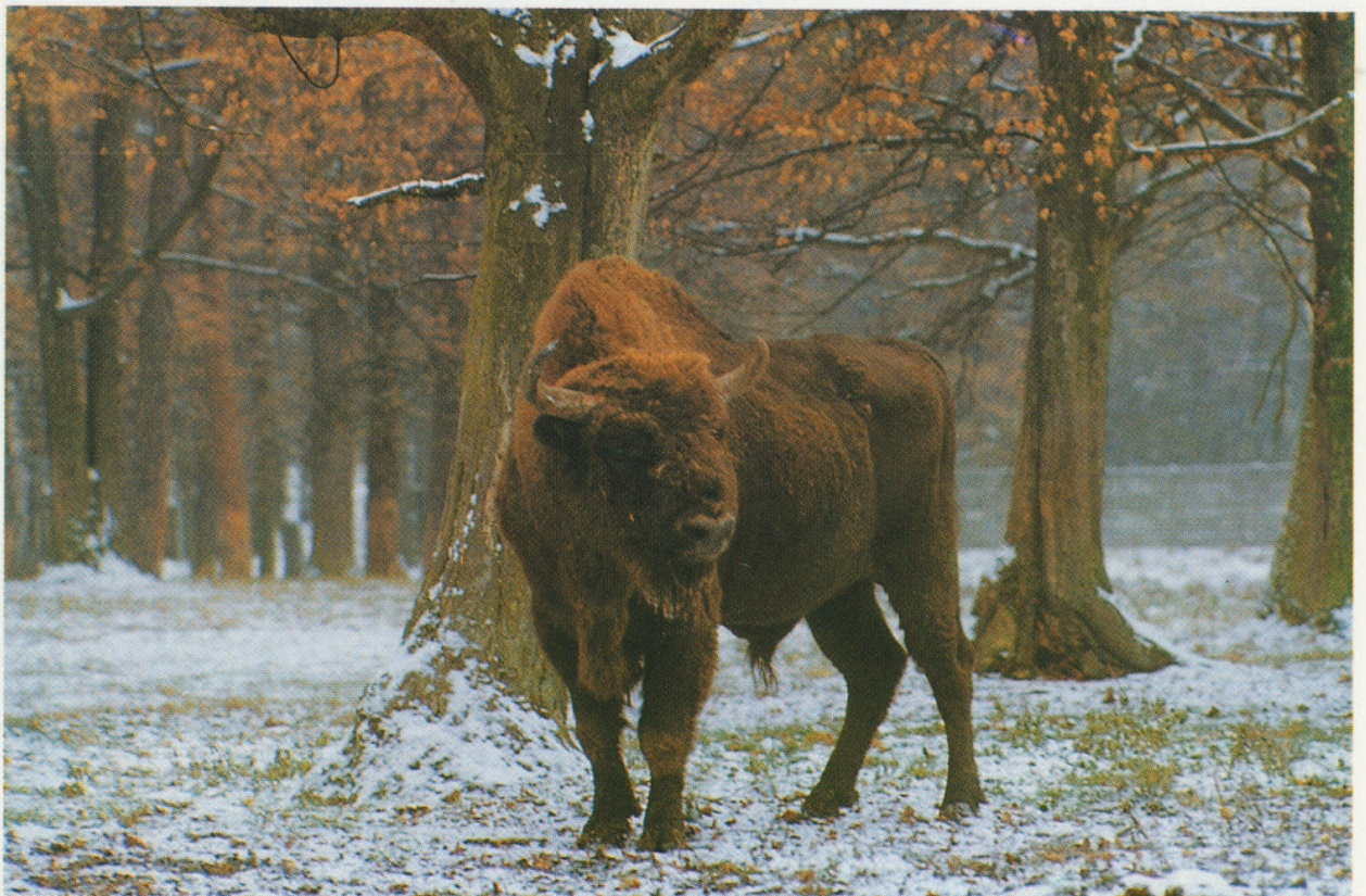
M 5150 POLSTACH