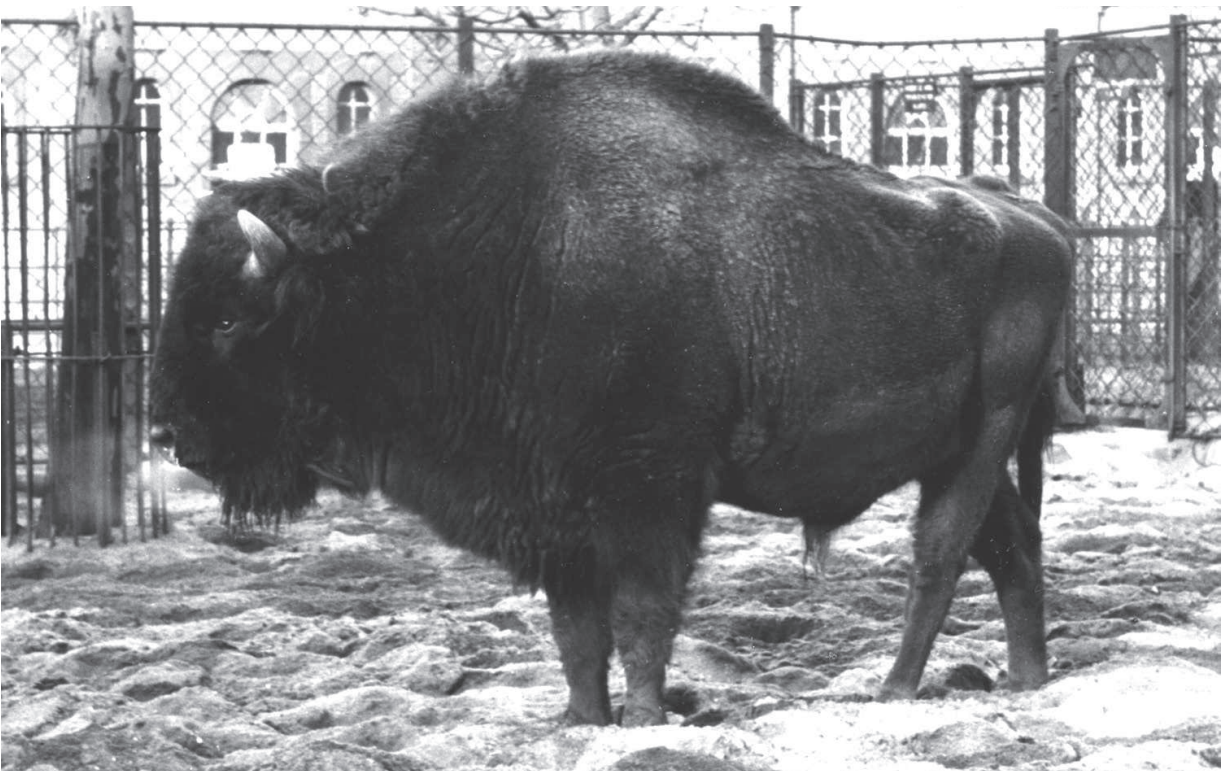
M 488 ARSÉNE