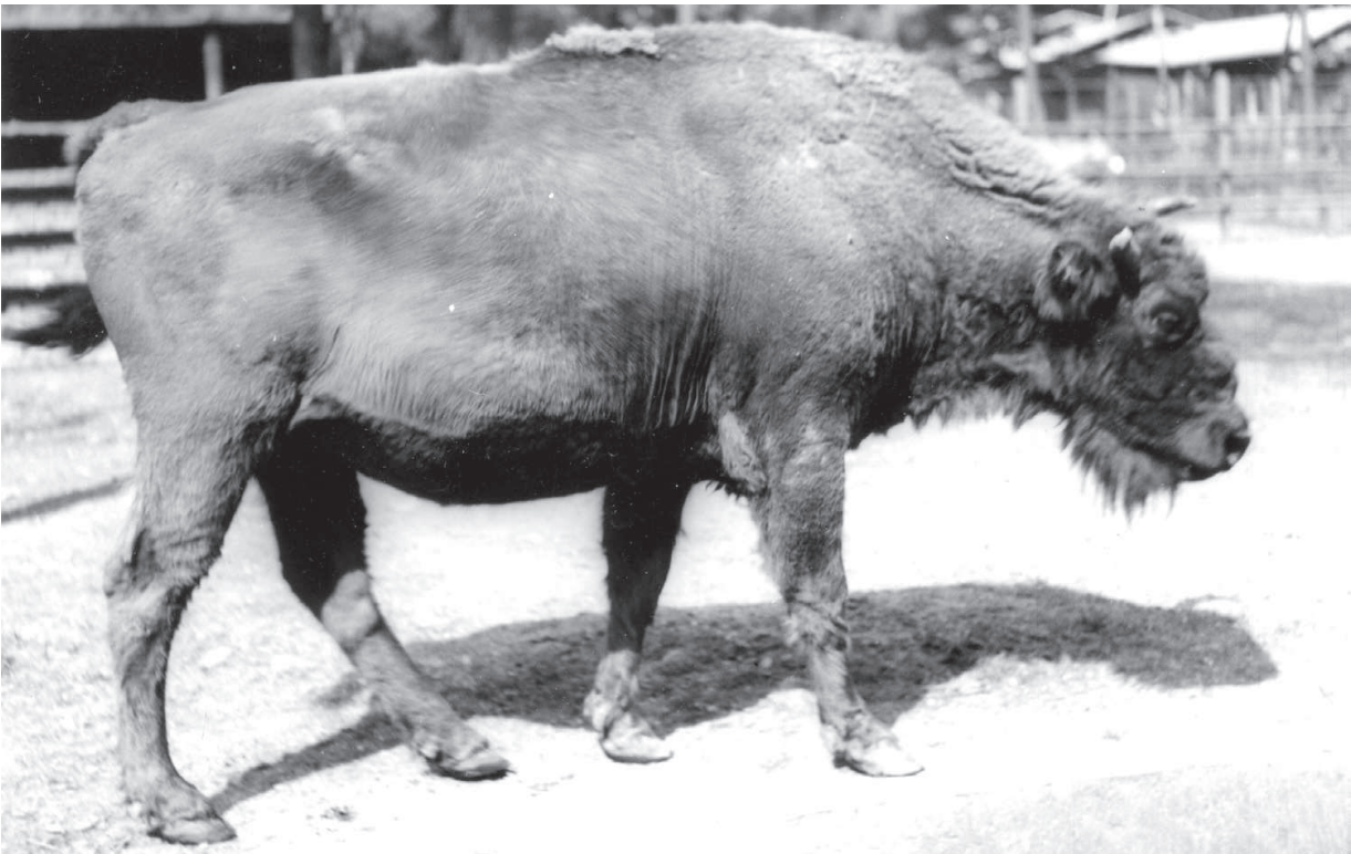
F 664 SPEICHE