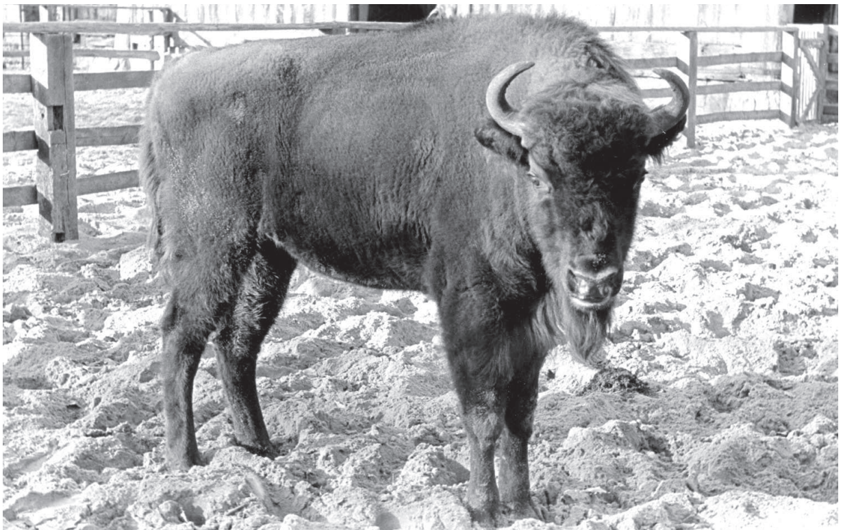
F 926 DULCE