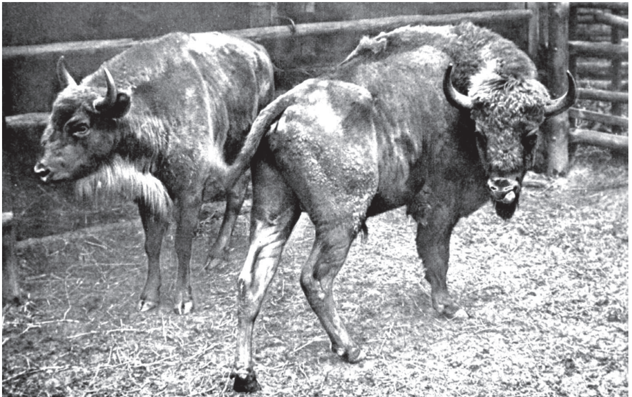
F 5 BELLA and F 4 BERSERKER