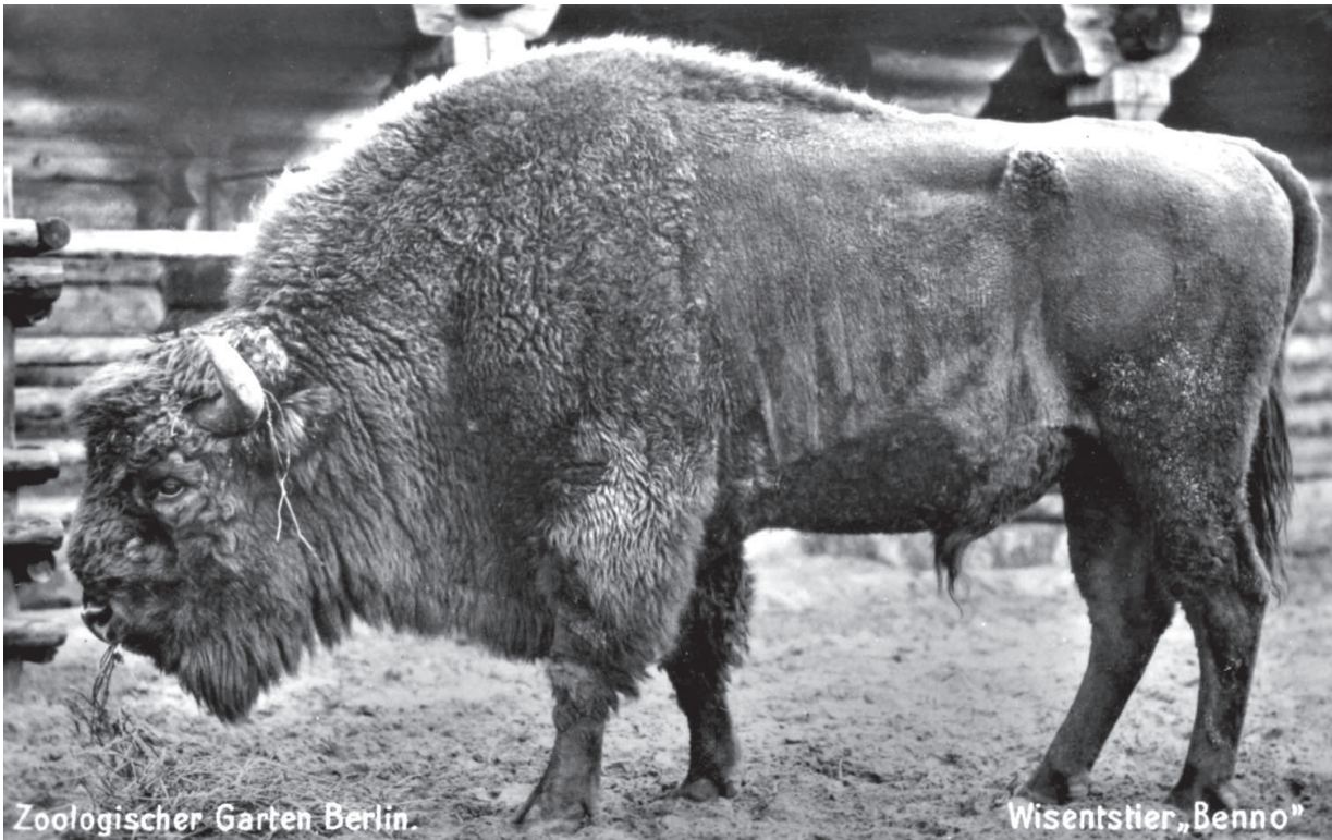
Zoologischer Garten Berlin.