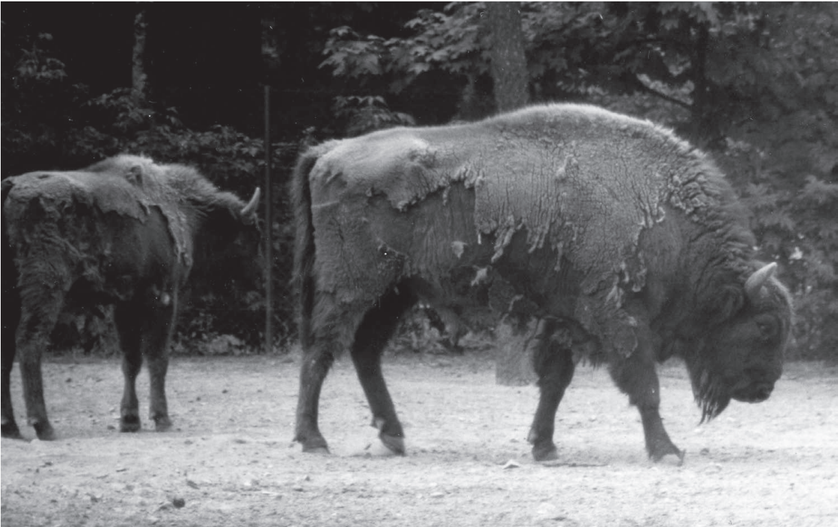
M 998 HECHT