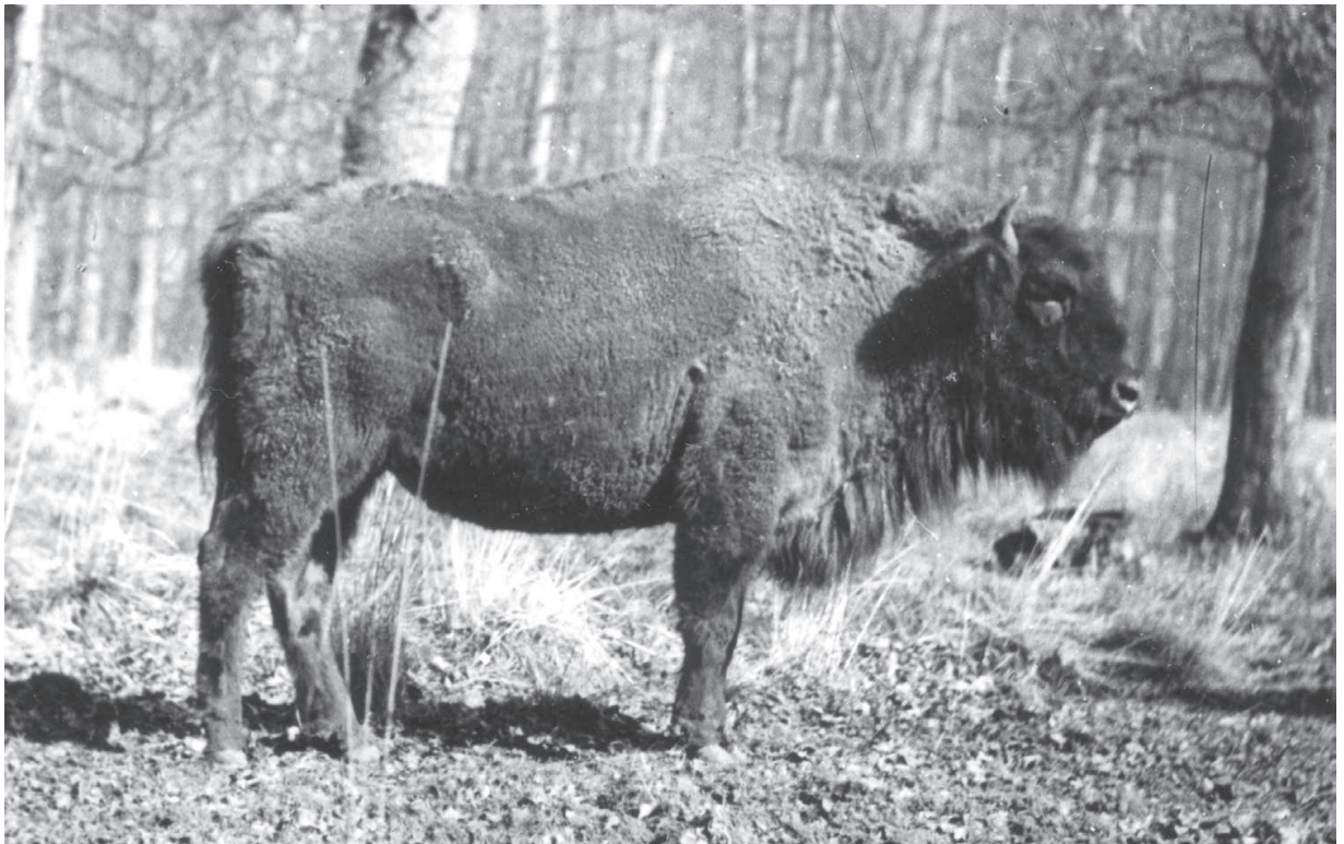
F 240 BORAH