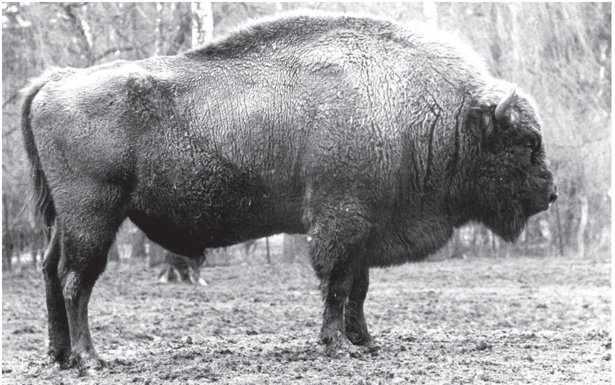
M 687 SPAN