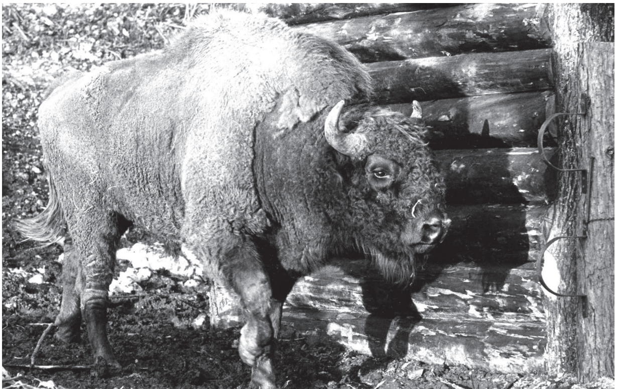
M 1254 HERD