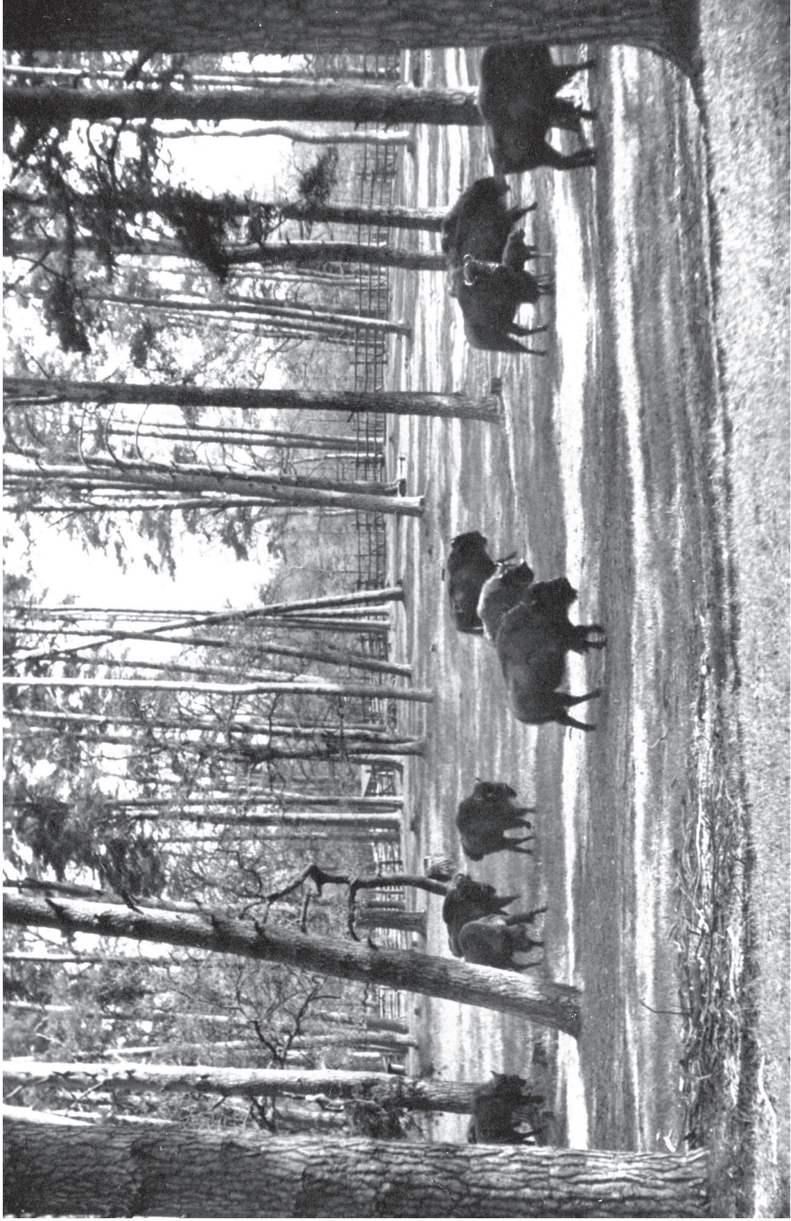
Schorfheide, czerwiec – June 1938