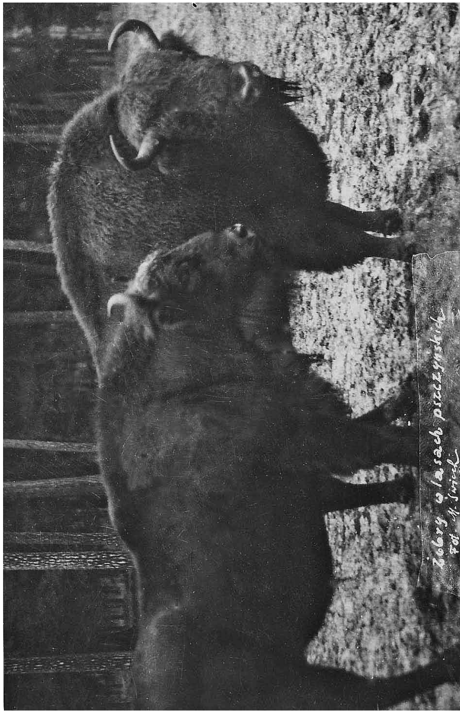
F 49 PLAKETTE, M 45 PLEBEJER

Zobry w la sach pszczymski