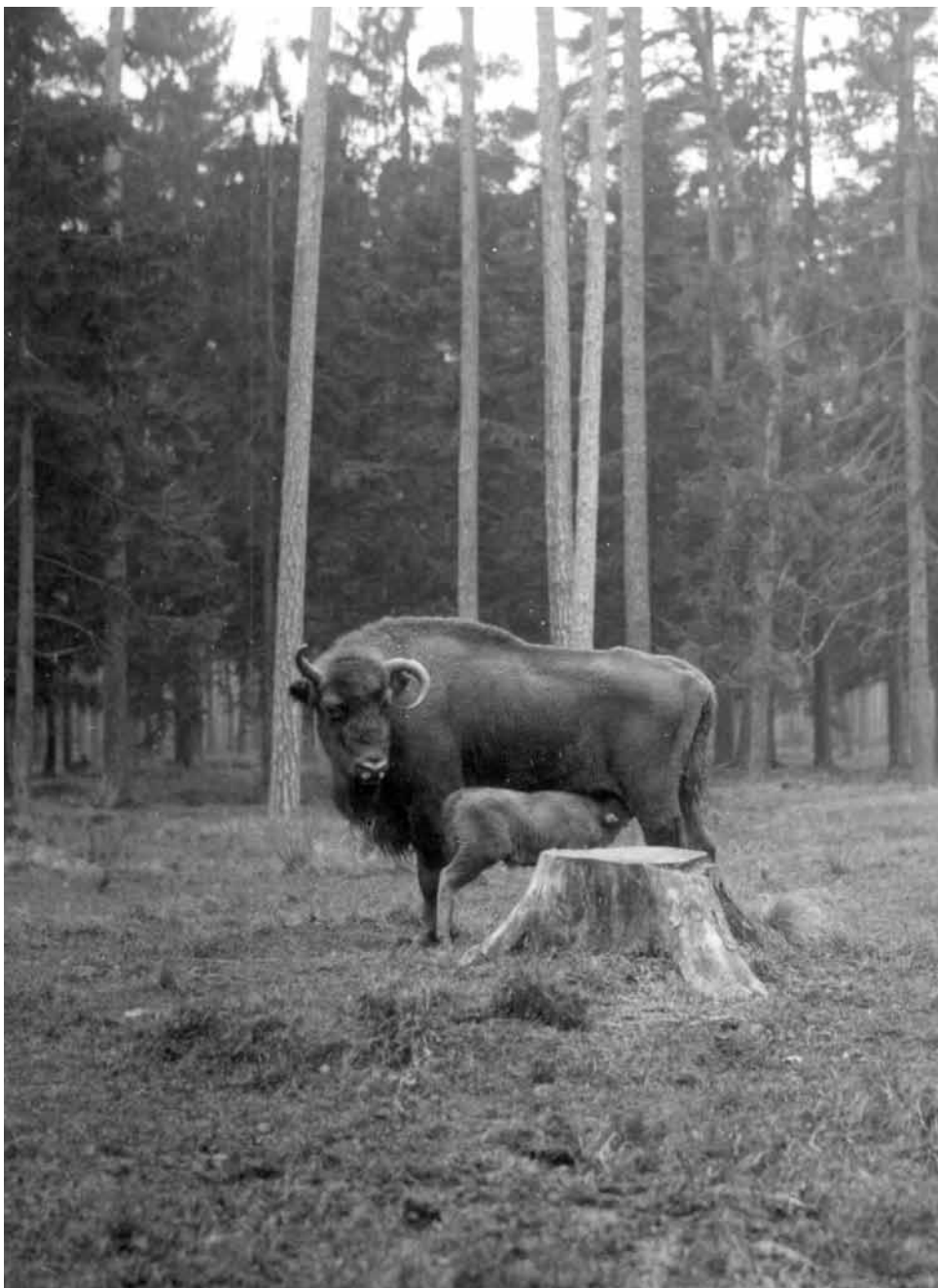
F 42 PLANTA