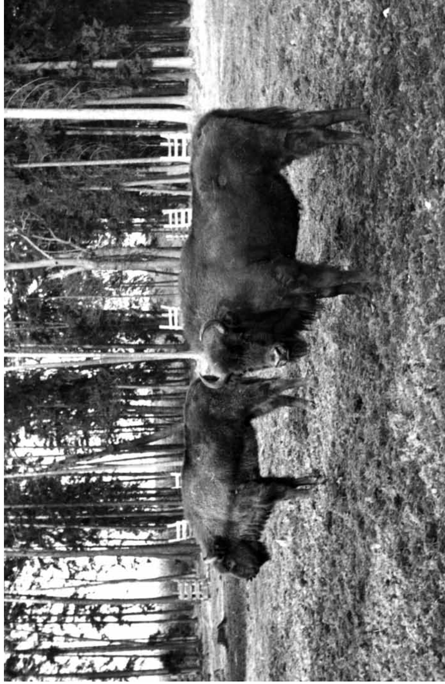
F 256 PLEINZE, F 219 PLANARIE