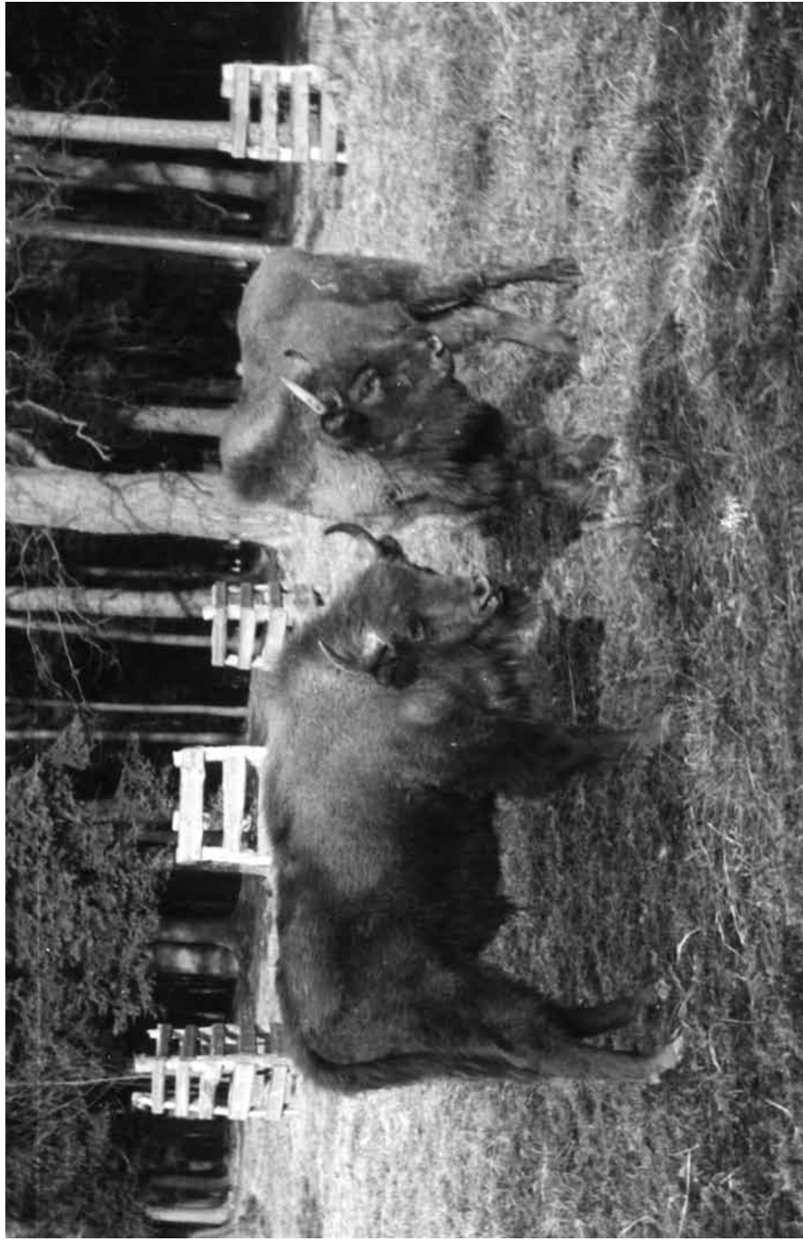
M 266 PLEŚNIAK, F 268 PLOTKARKA