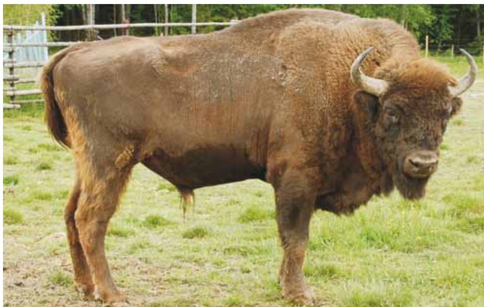
M 9913 ABURR

Avesta, 08.06.2009