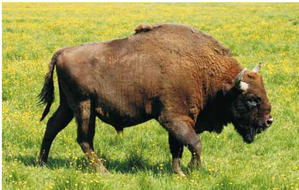
M 9127 AVPETER

Avesta, 08.06.2009