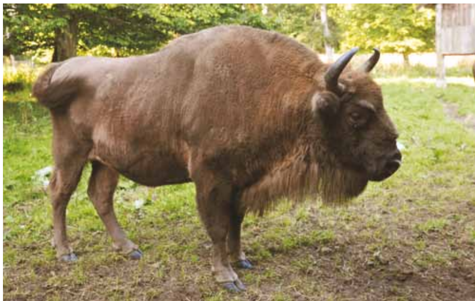
F 8319 POMOLOGIA