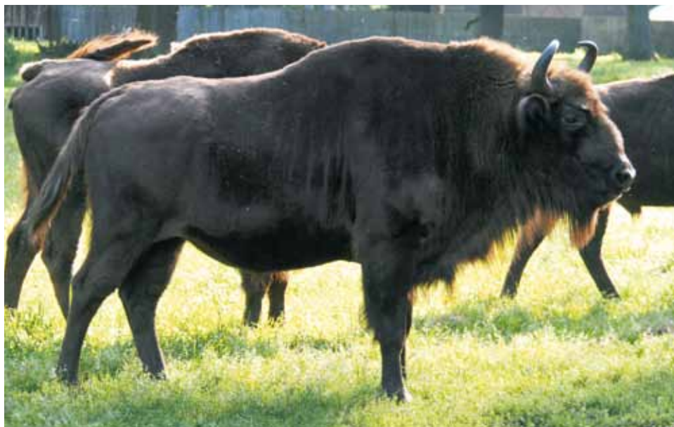
F 9170 POMYŁKA