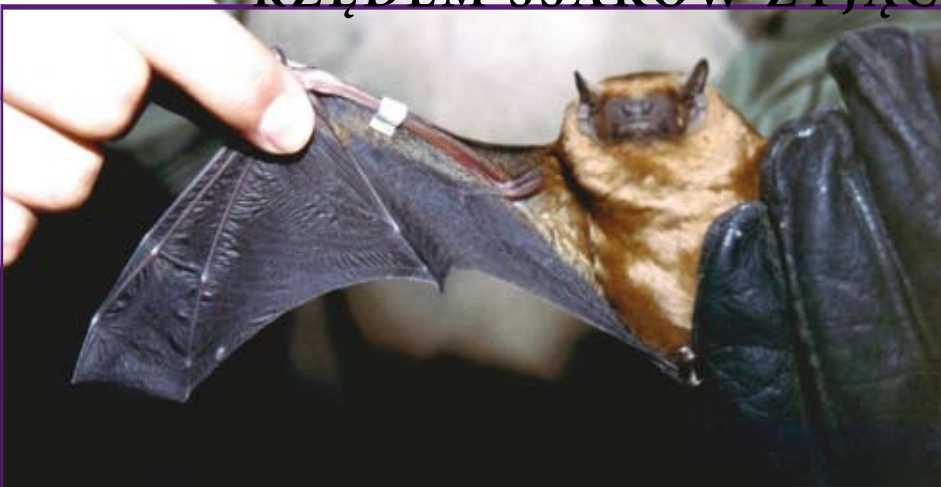
SAMICA BOROWCA WIELKIEGO ZAOBRĄCZKOWANA NA SŁOWACJI I ODŁOWIONA W PUSZCZY BIAŁOWIESKIEJ.

Nowa Księga Przysłów Polskich. J. Krzyżanowski (red.). PIW, Warszawa 1972.